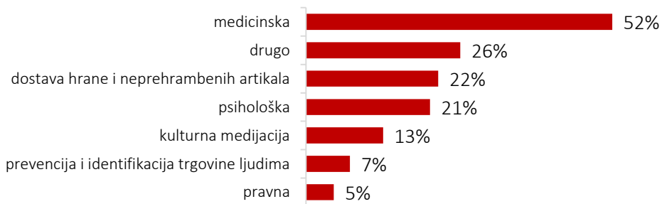
Slika 3. Tip usluga koje ispitanici pružaju